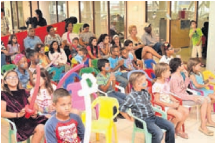
Continuacion di pagina 14

E ceremonia mes lo ta na Augustus pa e 30 finalistanan di mundo. Lo bay anuncia despues den prensa con e premiacionnan ta bayendo, Hollander ta splica.